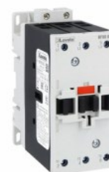
Stycznik mocy BF80